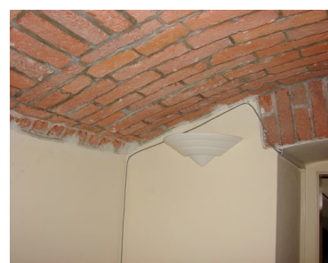
Kancelář - Office