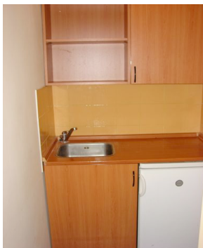
Kuchyňský kout - Kitchen corner