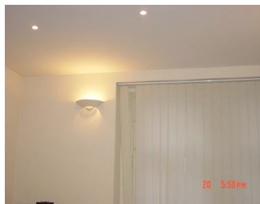
Kancelář - Office