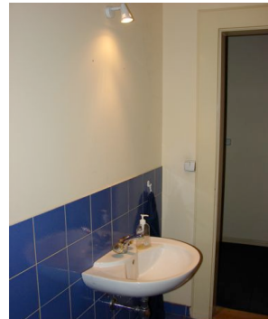
Koupelna - Bathroom